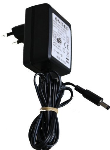
Netzgerät zum Aufladen

Wenn der Akku bald leer ist, leuchtet die gelbe LED kontinuierlich auf.